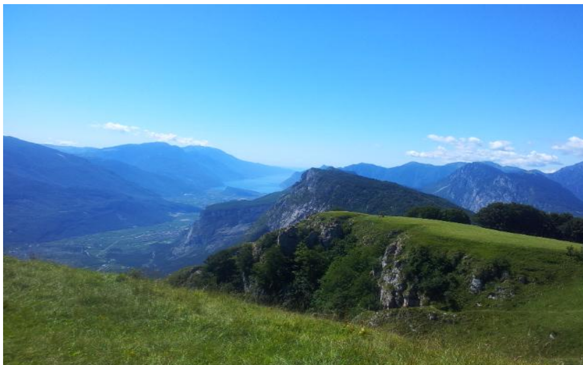
Lo splendido panorama sul Garda che si può ammirare dal Monte Casale, che sovrasta l'Hotel Villa di Campo.

Previa comunicazione, comunque, rimane possibile frequentare la sessione finale del Master anche non soggiornando nella stessa struttura o scegliendone un'altra.