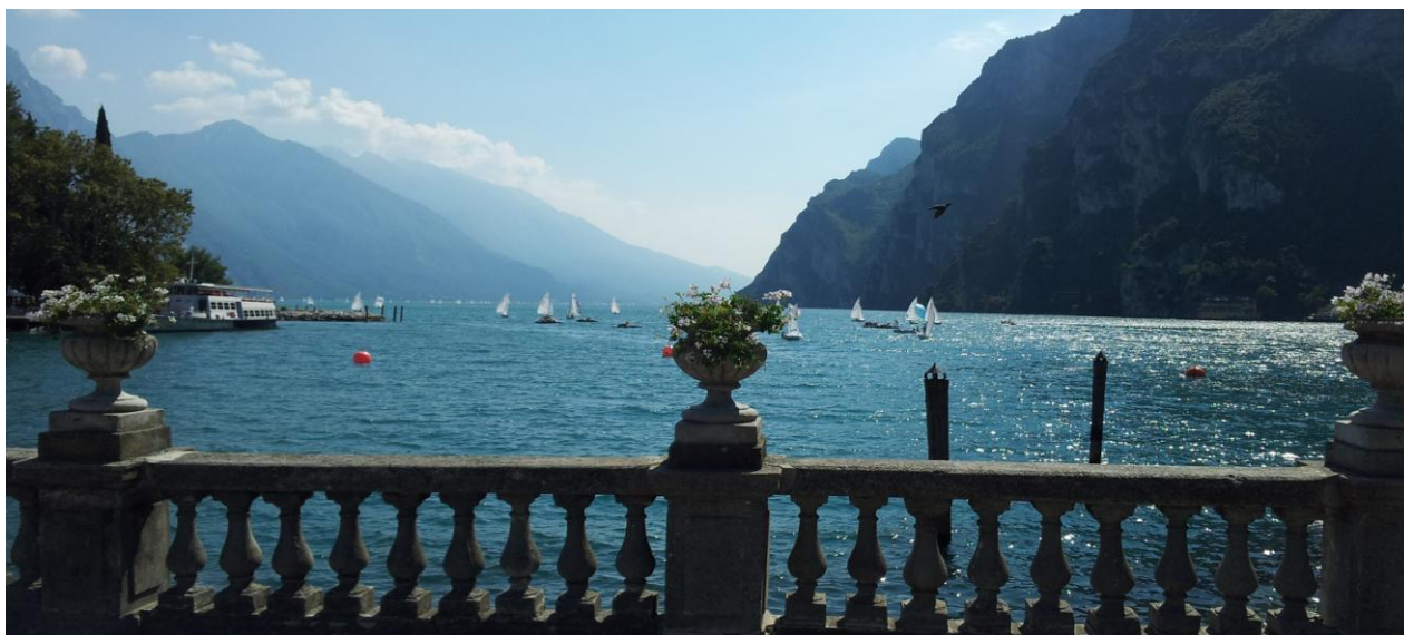
L'incantevole Riva del Garda, a meno di mezz'ora dall'hotel Villa di Campo.

AI PARTECIPANTI VERRANNO LASCIATI I CODICI DI TRADING SYSTEM REALIZZATI E FUNZIONANTI